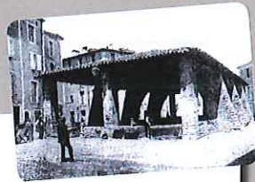
Les halles avant leur destruction.

Les Gangeois l'appellent la place couverte Mais pourquoi ce nom ?