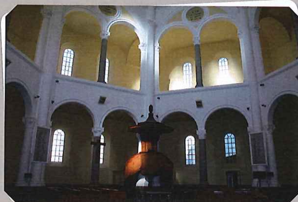
L'intérieur du temple

Le Petit Temple juxta l'édifice principal. Il accueille les fidèles en hiver et offre au public des expositions en été.