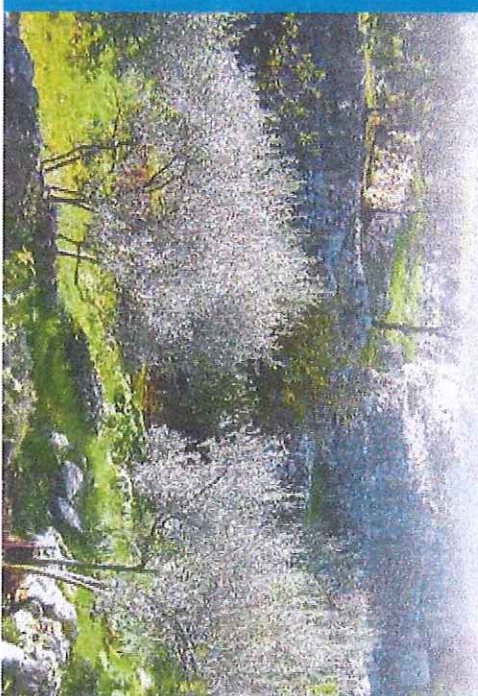
CULTURE D'OLIVIERS EN TERRASSES / PHOTO DOMINIEN 34

> Dans la région : • Ganges : maisons anciennes et passages voûtés, pont médiéval, église • Laroque : ancienne filature, village médiéval, château XII-XIII, église romane • Cazilhac : notias, château XI-XIV, église XII • Saint-Bauzille-de-Putois : grotte aménagée des Demoiselles, gorges de l'Hérault