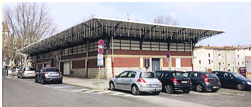
Les Halles de Ganges

Nous espérons inaugurer ces nouveaux espaces en 2024.