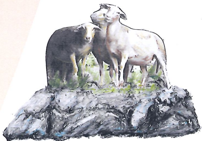
Dessine-moi un mouton...

Cette fresque est là pour signifier qu'à Ganges, Porte des Cévennes, le territoire particulièrement représentatif de la diversité de ces paysages culturels méditerranéens façonnés par les activités d'élevage doit être protégé !