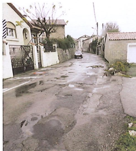
Rue de l'Albarède

Enfin, cette rue étant particulièrement vivante à certains moments, entrées et sorties du lycée du Roc Blanc, de l'école La Présentation et du théâtre Albarède, il était indispensable de limiter la vitesse des véhicules pour assurer la sécurité des piétons. Un plateau surélevé sera donc mis en place entre l'internat du Roc Blanc et le théâtre.